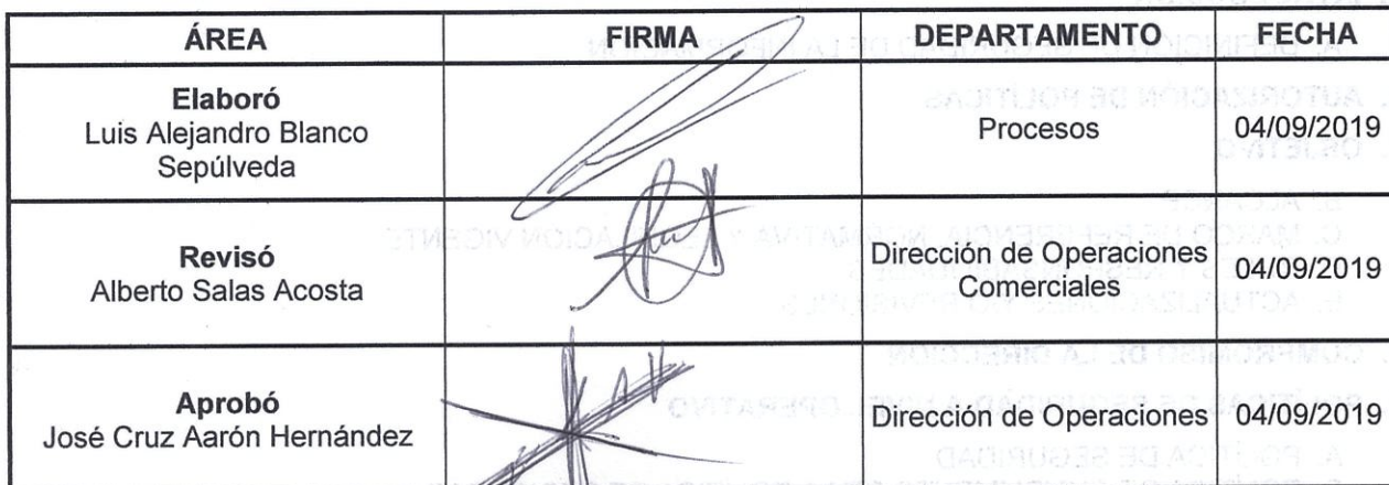
TABLA DE CONTROL DE CAMBIOS